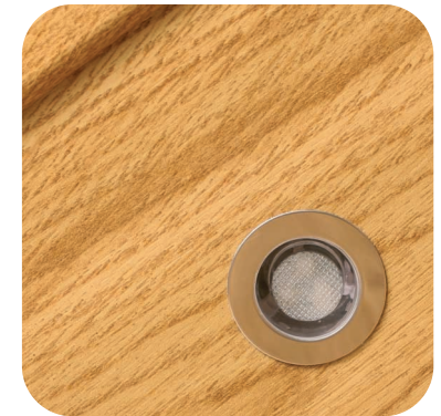
dress LED30 rund in die Wange eingebaut